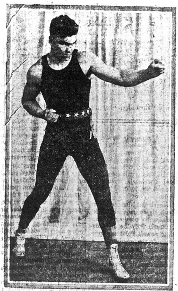
Jack Dempsey słynny pięściarz i szampion światowy