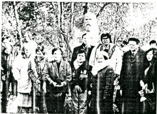
Uczestnicy konferencji w Južno-Sachalińsku (1991) na tle pomnika Bronisława Piłsudskiego