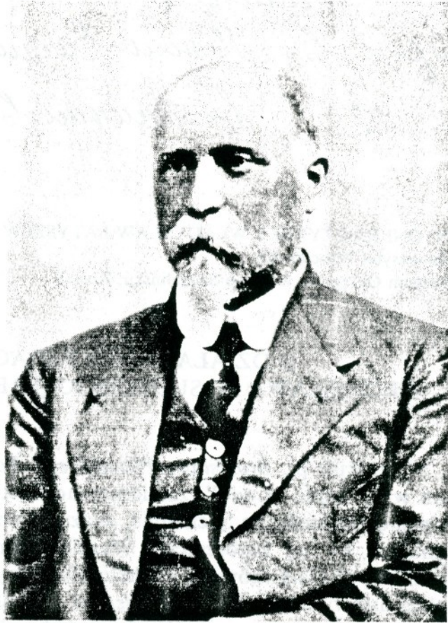
Bronisław Piłsudski (1866–1918)

środków i metod nauczania. Szkolenie w zakresie rzemiosła byłoby możliwe wspólnie z dziećmi przesiedleńców rosyjskich, ale konieczne w miejscu zamieszkania dzieci tubylczych, aby szkoła była dla nich widoczna i by mogli uznać ją za własną.”