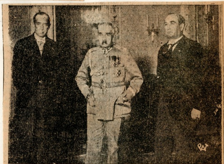
PIŁSUDSKI PRZYJĄŁ PREMIERA WĘGIER: — W listopadzie roku 1934 Marszałek Piłsudski przyjął premiera Węgier Gömbösa. Na fotografii od lewej: minister Józef Beck, Marszałek Piłsudski i premier Gömbös.