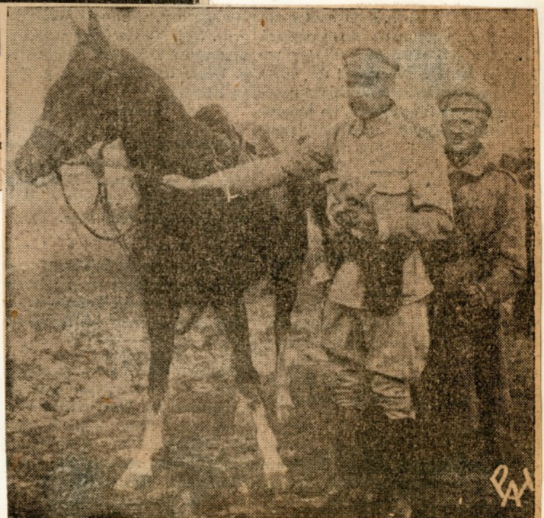
Józef Piłsudski w Legionach.