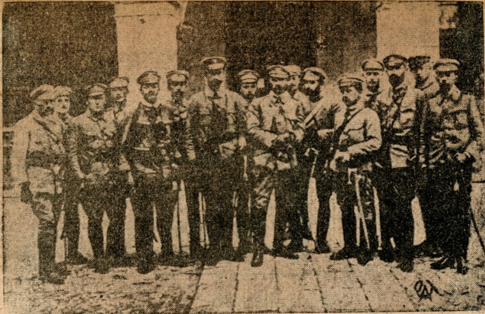
OFICEROWIE PIERWSZEJ KADROWKI: — Dnia 6 sierpnia 1914 roku, a więc bezmała 21 lat temu wstecz, wymaszerowała z Oleandrów pierwsza kadrowka Legionów Piłsudskiego. Na fotografii widzimy Marszałka Piłsudskiego (w środku) w otoczeniu sztanbu.