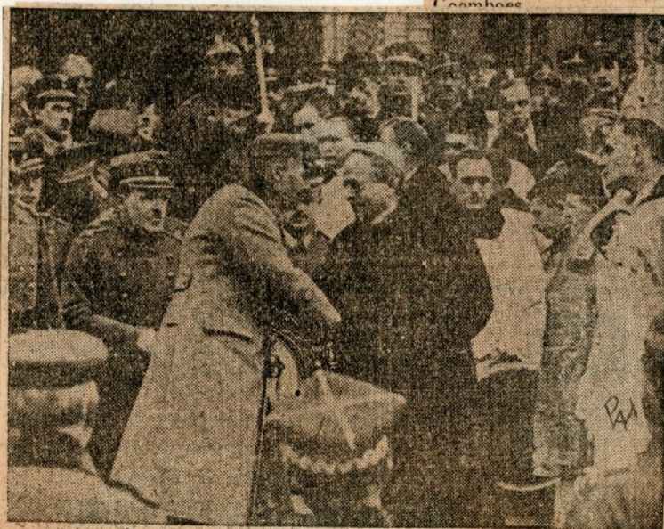
Powitanie Marszałka Piłsudskiego z nuncjuszem apostolskim Msgr. Rattim, obecnym Ojcem Św.