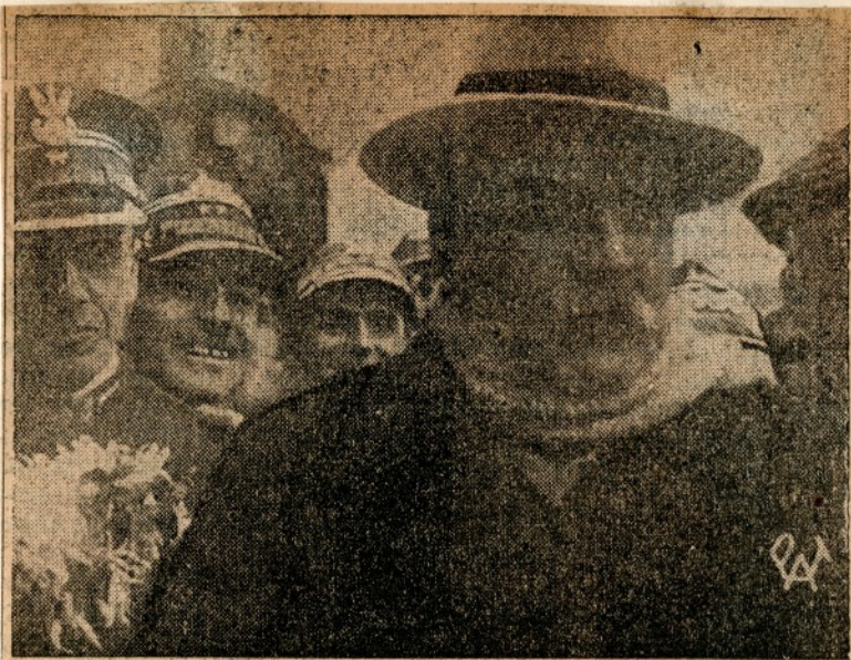
Marszałek Piłsudski przed wyjazdem do Genewy w Szwajcarii.