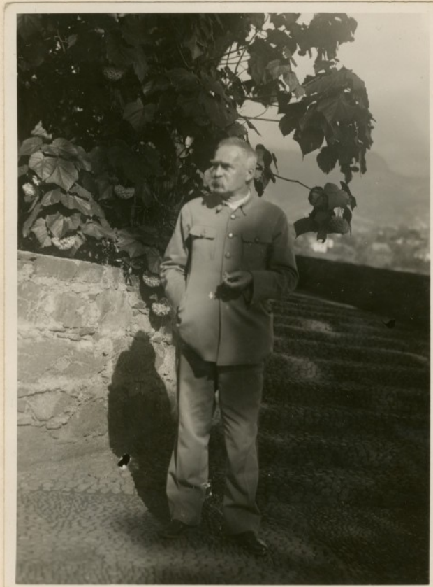
Marszałek na Madonie dn. 5 stycznia 1931r