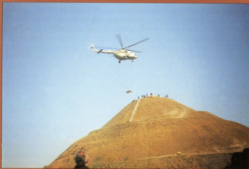
Podniesienie płyty z Krzyżem Legionowym na szczyt Kopca 8 października 1991 roku przez ppłk. Jerzego Tomalę — dowódcę 37 pułku śmigłowców transportowych w Łęczycy.