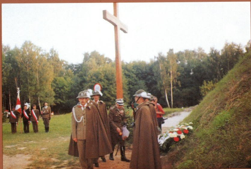
W przededniu Święta Wojska Polskiego — 14 sierpnia 1993 r.