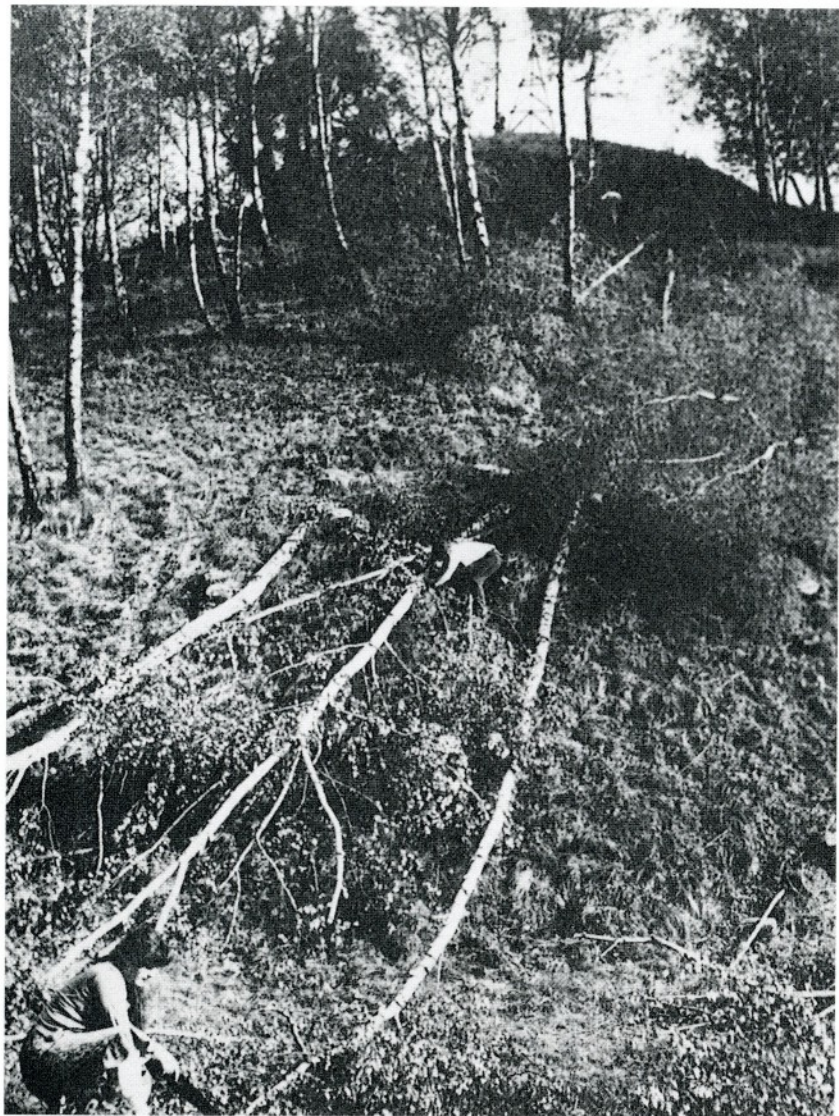
11 maja 1980 roku — jeden z pierwszych dni prac przy odnowie Kopca — widok od strony północnej.