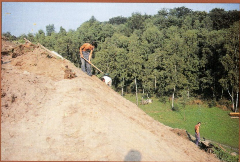
Prace na zboczach Kopca — 1991 r.