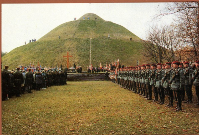
10 listopada 1991 roku — pierwsza po 1945 roku uroczystość Święta Niepodległości z udziałem Wojska Polskiego.