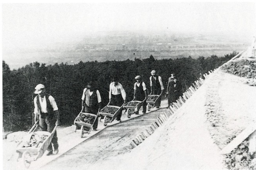
Prace przy sypaniu kopca