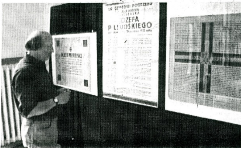
Maciej Beiersdorf prezentuje oryginalne publikacje z dnia śmierci Józefa Piłsudskiego.

Dokładnie o godzinie 20.45 w plątek czyli w momencie śmierci marszałka Józefa Piłsudskiego w sali Łuczniczkiej krakowskiego „Sokoła” przy ulicy Piłsudskiego 27 otwarta została wystawa pamiątek z warszawskiego, krakowskiego i wileńskiego pogrzebu Naczelnika.