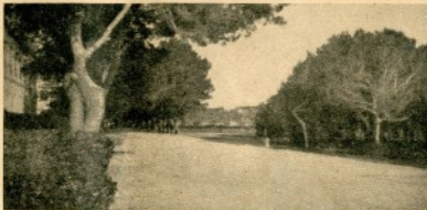
Akatemian puisto; takana urheilukentät.