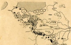
Joukkojen ryhmittäminen Warsavon taistelun aikana. Valk. sotkiot bolshevikkien, mustat puolalaisten divisionia.

sotamarsalkka Piłsudskin johdolla pikamarssissa Deblinin linnoituksesta ja Vierzjoelta (yksi jalkaväkiprikaateista marssi 24 tunnissa 78 km!) vielä Warsavon edustalla seisovan X neuvostoarmeijan selkään ja tuhosi perinpohjin tämän 8:n ja 10:n divisionan. Mozyrskin joukko heitettiin kohti itää ja pohjoista. Puolalaiset joukot etenivät keskeytymättä pohjoiseen ja koilliseen, tullen kauempina kosketuksiin peräytyvän III ja V neuvostoarmeijan joukko-osastojen kanssa ja tuhoten ne. Jo 23 p. elokuuta Bjełostok oli valloitettu. Brest-Litovskin linnoitus vallattiin 8-tuntisen tuiman pistintaistelun perästä.