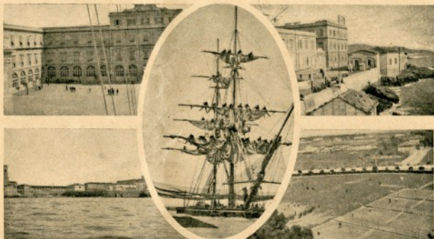
Osa akatemian suurta rakennusryhmää.