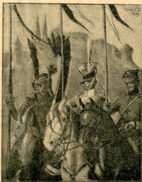
Puolalaisia ratsumiehiä eri ajoilta.

Hyökkäykseen Warsovaa vastaan oli määrätty suurin osa III:ta ja koko XVI armeija, jotka etenivät Radzi-minin suuntaan sekä molemmin puolin rautatietä Brest-Litovsk—Warsova. Sillä aikaa piti IV armeijan, joka muodosti äärimmäisen oikean sivustan bolshevikien länsirintamalla, XV armeijan tukemana mennä Weikselin yli Modlinin linnoituksen alapuolelta päästäkseen Warsovaa puolustavan Puolan armeijan selkään. IV armeijan rivelin kuului myös Kubanin kasakoista kokoonpantu 3.