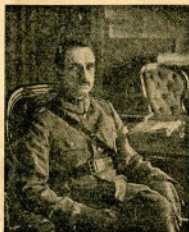
Puolan sotamigisteri, kenr. Sosnkovskii. Puolan itsenäisyysliikkeen johtomiehiä.

Warsovan taistelu ei ainoastaan tuonut mukanaan Puolalle haluttua rauhaa idässä ja kunniaa Puolan aseille sekä niiden johtajalle sotamarsalkka Pilsudskille, vaan todisti myöskin selvästi, että Neuvosto-Venäjän kommunistiset miljoonalaumat eivät kyenneet vastustamaan todellisen pyhän isänmaallisen innostuksen elähdyttämää, vaikkakin pientä kansallista armeijaa. Tämä kokemus oli suuri moraalinen tappio bolshevismille ja suuri voitto kaikille niille kansoille, joiden tehtävänä on puolustaa vapauttaan ja europalaista kulttuuria kommunismin hävittäjälajumia vastaan.