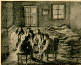
Joukko väsymättömiä oli kerääntynyt uunin ääreen.

— Oltiin ketjussa muutaman harjun laiteilla ja asuttiin silloin paremmin hissunkissun. Yht'äkkiä pyrähti eteemme aukaalle tuohon 50 metrin päähän metsänreunasta vahva punaisten ketju. Vimmattu tuli oli pian käynnissä molemmin puolin. Vihollisen puolelta kajahti huuto: «Kotkan punakaartin hyökkäyspataljoonan ensi pluttuuna. Hyökkäykseen!» Muutama punaista nondattivat tätä ensi kehoitusta, mutta pitkälle eivät he ehtineet, kun kaatuivat äkisti maahan. — Minä olin sivustamies, ja vasemmalla puolellani, vähän taempana, oli jyväskyläläisiä. Yht'äkkiä kuului kesken helvetillistä amunnan räiskettä jotakin lentävän ilmassa takapuolellani ja eteeni huomasin putoavan varsipommin, noin kolmen askeleen päähän minusta. Ser oli joku jyväskyläläinen heittänyt punaisia kohti. Pommi sähisi ilkeästi. Painoin vaistomaisesti päini lumeen ja ajattelmatta mitään odotin, milloin lennän ilmaan. Pommin sähinä oli iljetävää, se repi kuin tylsällä halkosahalla pitkin ruumista. Vks'kaks' se loppui, odotin henkeä pidätellen, mutta räjähdystä ei kuulunut. Kuulat vain vinkuivat korvisani. Lämpö alkoi palata jäseniin ja veri kiertää. Se onneton jyväskyläläinen oli asettanut näet nallin väärinpäin tai unohtanut sen kokonaan taskuunsa.