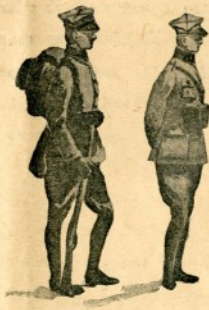
Puolalainen jalkaväkisotilas ja -upseeri.

Muista taisteluista mainittakoon pohjoisrintamalla olevan Ptoekin kaupungin puolustus; vähälukuinen garnisooni torjui siellä hätäisesti asetettujen kaupunkilaisten avustamana kaksi vihollisdivisioonaa (18. ja 53.), joiden jo oli onnistunut tunkeutua kaupungin kaduille. Tämä tappio esti bolshevikejä toteuttamasta aikomustaan mennä Weikselin yli tällä kohtaa. Weikselin jokilaivasto esti 3. ratsukorpuksen yllimenon Wlotzslavskin kohdalla. Voimattomassa vihasaan bolshevikit kohdistivat tykistönsä tulen asetonta Wlotzslavskin kaupunkia kohti. Samaan aikaan Budennyi etelässä ponnisteli valloittaakseen Lembergini, mutta yritys ei onnistunut ja lopuksi hän sai käskyn