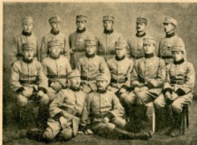
Kemin Suojeluskunnan laulajat.

Kemin Suojeluskunnan laulajat saivat Helsingin Laulujuhlla 24. VI. pidetyissä kilpailuissa mieskuorojen kolmannen palkinnon ja herättivät mainitussa juhlassa yleistä huomiota.