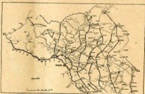
Puolalaisten vastahyökkäys ja bolshevikkien peräytyminen.