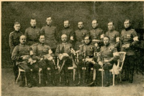
2:sen Divisionan Esikunta vv. 1920—1921.

Vuosikerran hinta 40:— Puolivuosikerran " 22:50 Yksitysnumerot 1:50 Kaksoisnumerot 2:— Ilm. hinta 90 p. mm.