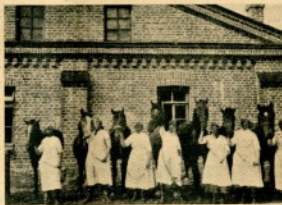
Eräs työala Lotille!

Minkälaisia lupausmuotoja eri yhdistyksissä niiden alkuaikoina käytettiin, ei ole vielä