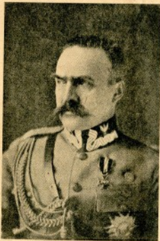
Sotamarsalkka Josef Pilsudski.

Tilanteen selvittämiseksi Puolan armeijan ylipäällikkö sotamarski Pilsudski päätti ryhtyä yleistaisteluun Warsovan luona ja antoi käskyn puolalaisten joukkojen siirtämisestä määrättyihin asemiin, joilta yleishyökkäyksen elokuun 6 päivän tiennoilla piti alkaa. Peruslinjana on Narev-joki Pultuskista Seretskaan — Warsovan Tait de Pont — Veiksel — Deblinlinna (ent. Ivangorod) — Wierp-joki ja edellinen pitkin Seret- tai Strypa-jokea. Päämääränä oli pidettävä 1) eristää Lemberg ja naftalahteet Vähä-Puolassa, 2) pysäyttää vihollisen eteneminen Warsovaa kohti, 3) Keskiarmeijan päämääränä oli Weikselin alajuoksusta hyökätä sivulta ja takaa Warsovan tienoille keskittyneen vihollisen kimpuna ja lyödä se pohjoisrintaman joukkojen avulla. Tämän suunnitelman toetuttamiseksi annettiin joukoille käsky nopeasti öisin vetäytyä vihollisen läheisyydestä siten, että jälkijoukot puolustautuisivat mahdollisimman kauan suo-