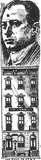
140 EAST 22 ST. N.Y.