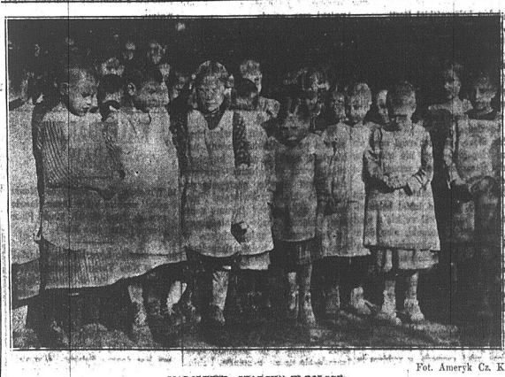
MAŁOLEJNI „STARY” W POLSCE

2) Granta przekazałaby ustalono normę, podległą wyłączeniu i dokoła podlegałoby między gospodarzami wiejskimi.