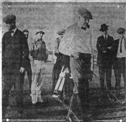
Prez. Harding używa sportu. — Bawiąc u siebie senatora Kelloga z Minnesoty, senatora Freleighuysena z New Jersey i senatora Hale z Maine, zaprosił ich na grę w golfa do Public Links, gdzie zapłaciwszy jak każdy przeciętny obywatel wstęp po dolarze, wygrał dwie gry z senatorem Kellogem.