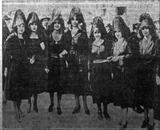
Wielki Pink w Madrycie. — Grupa artystek hiszpańskich w narodowych czarnych mantylach spacerują po ulicach miasta po zakończeniu koncertu. Jest stary zwyczaj obchodzenia Wielkiego Pinku.