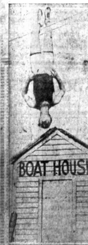
Herbert Stuni z Chicago, doskonały gimnastyk, pokazał niedawno nową sztukę w Lake Beach. Zawieszony płetnami na drucie w powietrzu, na pewnej wysokości, skoczył na płatek na równo nogi.