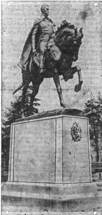
Pomnik Szymona Bolívara, bohatera wenezuelskiego, którego odsłonięcie miało miejsce we wtorek 19 kwietnia w Central Parku w New Yorku. Na uroczystości był obecny prez. Harding, który w mowie swojej podkreślił konieczność łączności wszystkich amerykańskich republik.