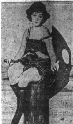
Nowy kostium kąpielowy, wyobrażające pająka z pajęczyną. — Konkurencja kąpielowych piękności w Kalifornii prowadzi do niezwykłych pomysłów. Wymyśliły kostium z pajęczyną, jakby i bez tego nie były w stanie opętać mężczyzny.