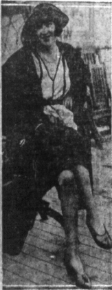
Panna Evelyn Valle — znakomita tancerka francuska, która otrzymała niedawno tytuł najzgrabiejszej tancerki w Paryżu. Panna Valle przyjechała do New Yorku i ma wystąpić na scenach amerykańskich, produkując nowe tańce.