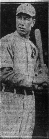
Jeszcze jedna znakomitość sportowa. — Earl Neale, jeden z najlepszych piłkarzy „czterwójnych” z Cincinnati, obecnie należy do graczy Filadelfijskich. Filadelfia w tym roku kusi się o złoty szampionat gry w piłkę (base ball).