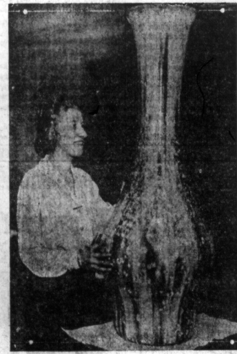
Waza sewrańska dla miast New Yorku. — Przepiękna waza z porcelany serwackiej ofiarował miastu New York w imieniu Francji, minister pełnomocny, Rene Viviani. Waza była posłana przez zwykłego do Waszyngtonu, ale zwrócono ją później do New Yorku.