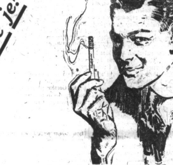
20 za 20 centów

CHESTERFIELD także położył zastugi dla tych ludzi, którzy szukają zadowolenia, zupełnego zadowolenia w paleniu prawdziwego tytoniu, którego smaku i sposobu PRZYPRAWIENIA NIE MOŻNA NAŚLADOWAĆ