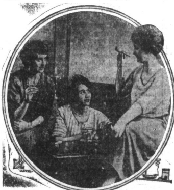
Kobieta i fajka. — Od niejakiego czasu, w Anglii zaczęły kobiety palić publicznie fajki. Na ostatniej wystawie-tytoniu w Londynie, eleganckie panie z „society”, pokazywały jak właściwie należy palić fajkę. „Podobno był to jeden z najciekawszych numerów programu wystawy, a kobiety wykazywały, że w kwestii palenia fajek, cygar i papierosów, są znakomitymi ekspertami.