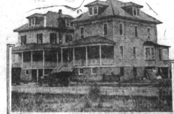
Idzie Dempsey będzie się trenował. — Dom w Atlantic City, N. J., gdzie J. Dempsey, szampion światowy w walce pięściarskiej, przygotowuje się będzie do zapasów z szampionem Europy, G. Carpentierem. Carpentierowi proponowano Atlantic City, ale wybrał on miejsce zacisze w Manhattan, L. I.