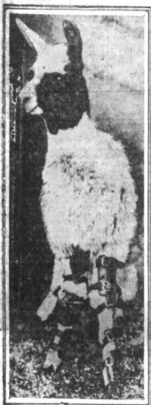
Prostawanie nóg Lamię. — W zoologicznym ogrodzie w Cincinnati, urodziła się niedawno Lama, z rodziny wspaniałych kóz tybetańskich. Ale małżeństwo nie mogło chodzić. Za słabe miało nogi. Na to doznany znalazł sposób. Chwiejące się nogi zwierzęcia ujęł w specjalne klamry i według orzeczeń specjalistów, — Lama będzie mogła normalnie biegać za parę tygodni.