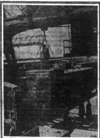
Nowy system przewożenia poczty koleją. — Do przewożenia poczty, są obecnie wprowadzane na wszystkich liniach kolejowych specjalnie konstruowane wagony. Wagony służą głównie do przewożenia gazet, katalogów i t.p.