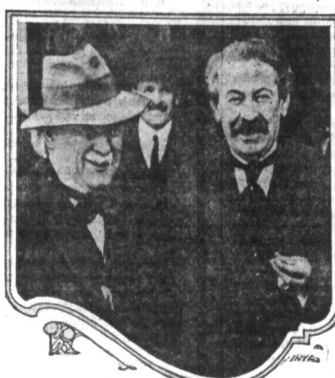
Dwaj premierzy się śmieją. — Fotografja powyższa przedstawia Lloyd George'a, premiera Anglii i premiera Brianda, premiera Francji, po konferencji w Lympe w Anglii, gdzie postanowiono wysłać ultimatum do Niemiec w sprawie odszkodowań. Obecnie sytuacja się nieco zmieniła i bodaj czy obaj premierzy, będą w wesołym nastroju, gdy się za parę dni spotkają w sprawie Górnego Śląska.