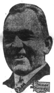
Tomasz Mooney. — Wybitny przewodca robotniczy, który skazany został na dożywotnie więzienie, Mooney, oskarżony o rzucenie bomby podczas patriotycznego pochodu w San Francisco w Kalifornii, stoczył i toczy jeszcze walkę o wolność. Wina jego nie została dostatecznie ustalona i obecnie są czynione starania, aby sprawa Mooney'a ponownie była rozpatrywana w sądzie. Dwa lata już siedzi on w więzieniu San Quentin.