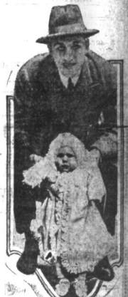
Carpentier daje lekcję swojej córce. — Słynny pięściarz G. Carpentier, który przed kilkoma dniami przybył do Ameryki, aby stoczyć walkę o szampionat światowy z Dempsey'em, na czteromiesięczną córkę. Na fotografji widzimy groźnego zapasnika, jak uczy dziecko, stawiania pierwszych kroków.