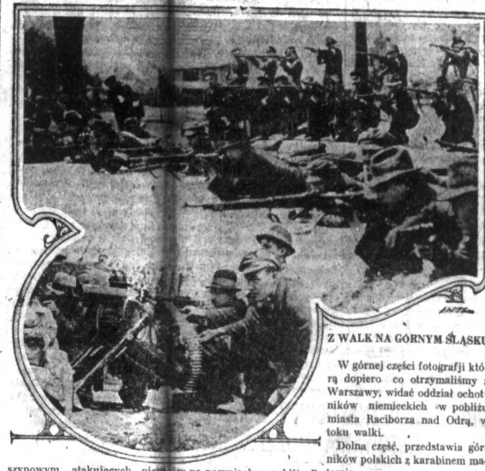
Z WALK NA GÓRNYM ŚLĄSKU

W górnej części fotografii którą dopiero co otrzymaliśmy z Warszawy, widać oddział ochotników niemieckich w pobliżu miasta Raciborza nad Odrą, w toku walki. Dolna część, przedstawia górników polskich z karabinami maszynowymi, atakujących Niemców na pozycjach w pobliżu Tomia.