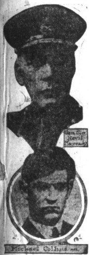
Podpisują rozejm angielsko-irlandzki. — Michał Collins, głównodowodzący irlandzką republikancką armją, który podpisał rozejm ze strony Sinn-Fein, i generał sir Nevil Macready, dowodzący wojskami angielskimi w Irlandji, który podpisał ze strony rządu angielskiego.