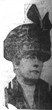
Kandydatka na kontrolera New Yorku. — Pani Harriet Stanton Blatch, siostra od szarego lat sufragietki została nominowana kandydatką na kontrolera miasta New Yorku na liście socjalistycznej. Pani Blatch otrzymała nominację przez skłanianie na ósmą i dziewiątą konwencji socjalistycznej partji w New Yorku.