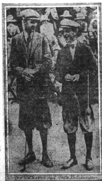
Przed rozpoczęciem gry w St. Andrews, w Szkocji. — Roger Wethered, amator angielski i Jock Hutchison z Chicago przed rozpoczęciem gry w golfa o szampionat, która odbyła się w St. Andrews, w Szkocji. Wethered wkrótce przybędzie do Stanów Zjednoczonych grać z najlepszymi amerykańskimi graczami, amatorami i profesjonalistami.