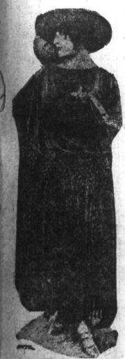
Nowe mody na wysiędach. — Fotografia powyższa przedstawia ostatni fason sukni, jakimi ukazał się podczas wysiędów w Antantii we Francji. Jest to kombinacja peleryny i szale.