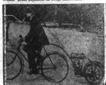
Rower pchnięty za pomocą motora. — Nowy ten wynalazek może być łatwo zastosowany do każdego roweru. Koszt nadzwyczaj mały. Jeśli paliwa gazolinowa wystarcza na trzydzieści mil. Każdy, kto umie jeździć na rowerze, może użyć tego przyrządu. Szybkość, z jaką można jeździć przy użyciu tego przyrządu, jest 30 mil na godzinę. Prace pomiaru motora z tyłu roweru jest o tyle dobre, że nie zasłonił szprawy jeźdźcy.