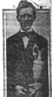
Jock „the Hutch” ze zwycięskim pułkarem. — Jock Hutchison z Chicago zdobył wicę szampionatu brytyjskiego golfowego, który niedawno powrócił do New Yorku. Trymna on pułkar, który mu ofiarowano po zdobyciu szampionatu.