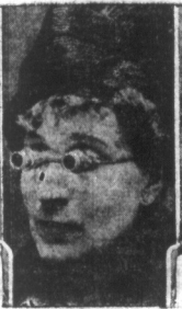
Nowy typ lornetek. — W Niemczech są rozpowszechnione lornetki teatralne na kształt zwykłych okularów. Lornetki te są o tyle wygodniejsze od tych, których używano dotychczas, że można swobodnie używać rąk.