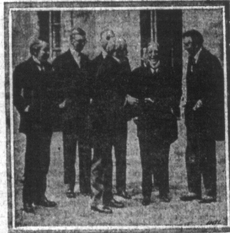
Prezydenci Francji wita dyplomatów najwyższej rady. — Członkowie najwyższej rady przepędzili przyjemne chwile w samku prezydenta Milleranda w Rambouillet. Z lewej ku prawej stronie widac: prezydenta Milleranda, (2) premiera Brianda, (3) ambasadora Stanów Zjednoczonych Harveya, premiera Lloyd Georgera i ambasadora Herricka.