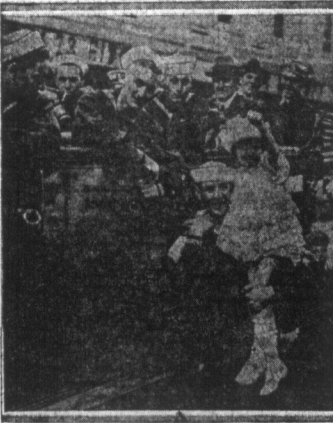
Komedia uczuć. — Załoga okrętu wojennego „Utah” wita radośnie w Londynie zwiędzających z dziećmi londyńskimi. Komedia uczuć. Matki S. S. Utah obecnie mają „good time” w stolicy Albjonu.