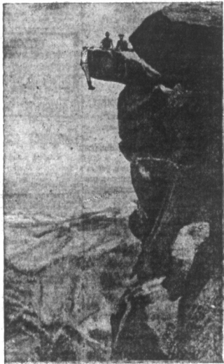
Karkotomne sztuki. — W Yosemite National Park w Kalifornii jest skała stercząca nad przepaścią 3000 stóp głęboko. Często samobójcy i turyści do tej skały wędrują, lecz bożnie oko policji parku pilnie śledzi i zbyt odważnych arestruje. Nad przepaścią jest napis następującej treści: „Przebieg jest 3000 stóp głęboko. Zaden pogrzebowy nie odnajdzie cię tam. Jest różnica między odwagą a śmiałością. Jeżeli sobie za dużo porwalisz, zostaniesz arestowany”.