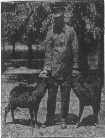
Poraz pierwszy od 15 lat w Ameryce. — Do zwierząt w Bronx Park przywieziono dwie młode anocy. Jest to gatunek nie tylko rzadki, ale nadzwyczaj osobliwy. Największą przyjemnością dla tych zwierzątek jest głośkanie ich grzbietu, od ogona ku głowie. Aucca przy pięciu robi nadzwyczaj długie tyki.