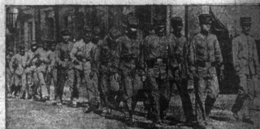
Wojaka republiki Costa Rico idą bronić ojczyzny. — Wojaka Costa Rico w marcu przeciw nieprzyjacieli republiki. Zwracamy uwagę na bolstrów maszerujących w tynych rzedach, chodzących bosy.