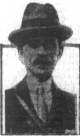
Minister Peracji przyjechał do Stanów Zjednoczonych. — Mirza Hussein Khan Alah, nowy minister Peracji dla Stanów Zjednoczonych, przyjechał do Ameryki i w towarzystwie dyplomatów perskich udał się do Waszyngtonu.