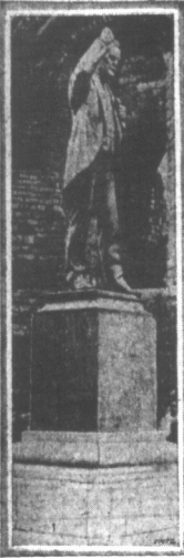
Pomnik Lloyd'a Georgera. — Lloyd George nie czeka, aż go przysiądzą ukoronować i z radością przyjął wiadomość o odkryciu jego pomnika w Carnarvon, w prowincji Wales, z której ten nieśmiertelnik pochodzi.