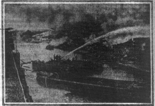
Wielki pożar w Londynie. — W składzie drzewa w Scotland Yard wybuchł pożar, który w sześciu godzinach zniszczył ogromny skład drzewa, wyrządzając szkodę na półtora miliona dolarów. Gdy w pracowni Scotland Yard zabrakło kilku robotników, zarządził podjęcie ogłoszenie do gości, że poszukują 30 robotników (po 3 dolarów tygodniowo). Na podziwie tego ogłoszenia zgłosiło się 5000 robotników, którzy nie otrzymawszy zjazdu podpalili skład drzewa.