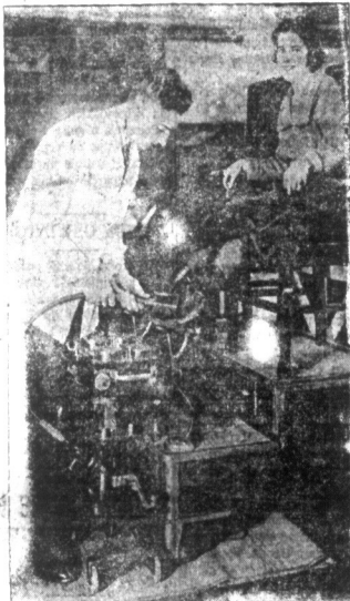
Czyszczenie butów za pomocą elektryczności. — Na wystawie przyrządów elektrycznych znajduje się i aparat do czyszczenia trzewików. Jedno porażenie guzika a trzewiki w jednej chwili są czyste i polyskujące. Wobec tej szybkości i sprawności maszyny wielu ludzi straci zarobek.