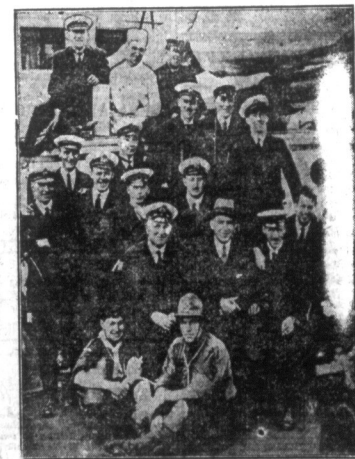
Shakleton i jego załoga. — Słynny przyrodnik angielski udał się w podróż na biegun dla badań przyrodniczych. Hycina przedstawiła Shakletona w cywilnym ubraniu z zabiegami na pokładzie małego okrętu „Quest”, na którym podróżnicy będą przebywali przez dwa lata.