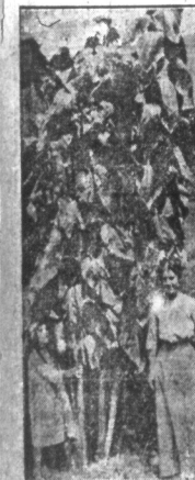
Niezwykły okaz. — Na farmie w Iowa znajduje się rzadki, ten wyrósł na farmie dzięki słońcu, który jest 14 cali wysoki. Słonecznik „Dobry” w Iowa.