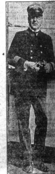
Kapitan Bayern. — Oskar Schwamberger, kapitan okrętu Bayern, pierwszego niemieckiego okrętu, który przybył do portu nowojorskiego od wybuchu wojny. Schwamberger został przyjęty przez majora Hylana.