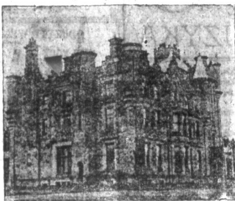
Prawdopodobna siedziba gabinetu w Ulster. — Zamek Stormont, w okolicy Belfastu prawdopodobnie zostanie nabyty jako siedziba dla parlamentu Ulster. W budynku, który ma kosztować 100 tysięcy dolarów będą poszczególni ministrowie.