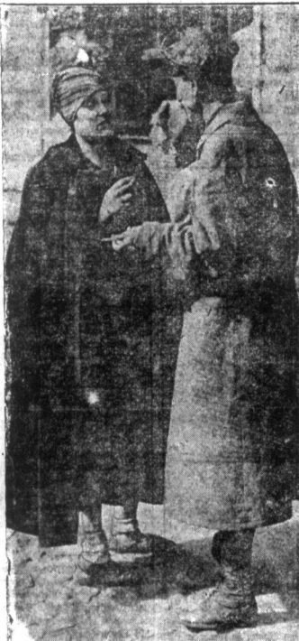
Nowa moda. — Najnowsza moda w wyrobieniu płaszczy, znajduje wzór w stylu moskiewskim, gdzie kobiety noszą płaszczyki zwinięte do kolanek.