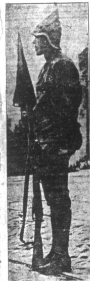
Na posterunku. — Żołnierz armii sowieckiej na strażnicy. Przy bagnetach tkwi czerwona chorągiewka.