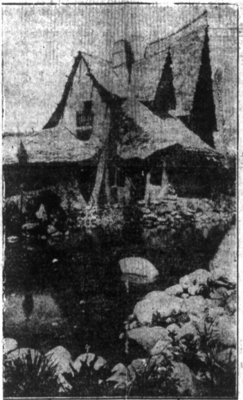
Kalifornia. Studja artystyczne, podobne do powyższej odffotografowanego są podobne w Stanach Zjedn. Powyższe studio mieści się w Los Angeles w Kalifornii.

A. CISEK, ELEKTRYCZNY KONTRATOR Wykonuje wszelkie roboty w zakresie elektrycznym. Zakład przyborów elektrycznych. Zgłosze się po cokolwiek wam będzie potrzebne w tym zakresie. Biuro: 465 Manhattan Ave., przy Driggs Ave., Brooklyn, N. Y.