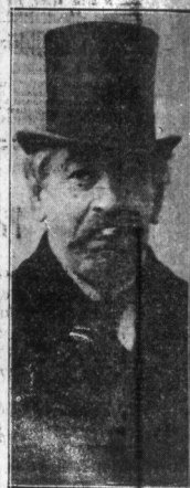
Premier Briand. — Premier francuski Briand, który wygłosił na konferencji w Waszyngtonie najlepszą mowę, wczoraj opuścił Amerykę. Premier Briand pośrednio wystąpił w obronie interesów Polski, jako przyjaciel węgry i polskij.