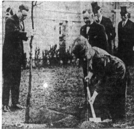
Władczyca miłości. — Jej królewską mość, królowa angielska, Małżonka króla, wspaniale wspaniale uczyła się przy sadzeniu namiatki w ogrodzie w Narodowym Instytucie Rolniczym w Wandbridge.