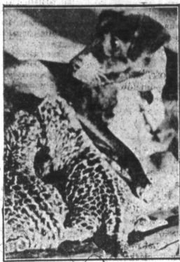
Sieroty. — W zwierzyńcu w Cincinnati, pozostali sieroty, cztery młode pantery. Byłoby niechylne żaloby, gdyby nie słońca, która się sierotami zapiekowała, karząc je z miłosierdzia. Wzruszający obrazek z życia zwierząt.