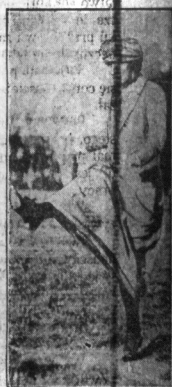
Księżka gra w piłkę nożną. — Księżka Astora, w której to miesiącu grała w piłkę nożną, jak arystokratyczna matka — również sędzią z tematu sportu.