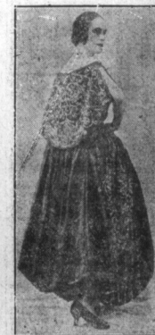
W Paryżu. — Kobiety paryskie obecnie wróciły do mody, która od dawna drzemie w roznikach historycznych. Okazało się, że kobiety pięknie są piękne w tych sukniach, — a brzydkim i to nie pomaga.