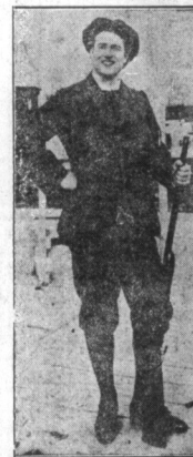
Następca Carusa. — Giovanni Martinelli, który jest zastępcą Carusa w Metropolitan Opera Co., spędza chwile wolne, strzążeniem do mety.