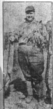
Największy myśliwy. — Boots Fabing nie jest najlepszym ale bezsprzecznie największym pod względem objętości ciała myśliwym. Jest 6 stóp wysoki i waży 248 funtów.