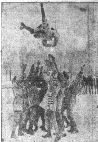
Niedelikatne przyjęcie. — The Montreal Snow Shoe Club przyjmuje nowych członków jak na rycinie widac.