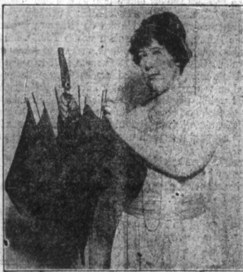
Parasol. — Golem przyszłości parasolki do sukni, wynaleziono nowy patent, który umożliwia naciąganie odpowiednich materji na druty parasola stosownie do sukni.