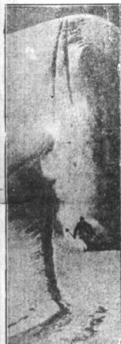
Sport w Sewajcarji. — Fotografja zdjęta w Adelboden, przedstawia sport zimowy w Sewajcarji.