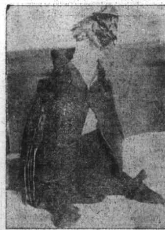
Szczeciólna kura. — Odznacza się nie tylko tem, iż ubra na ją w surdut Charlie Chaplina, ale też niezwykłym usposobieniem. Kura ta stroni od towarzystwa, nie składa jaj i jest okazem niezwykłym.