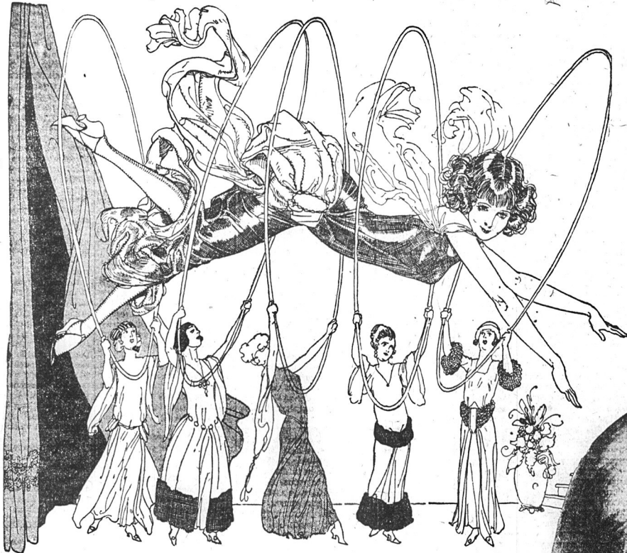
CÓRKA NA WYDANIU