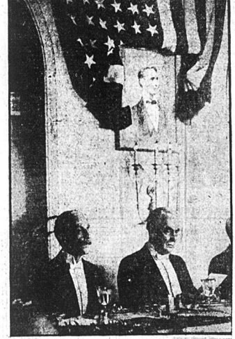
Pod portretem wielkiego emancypatora A. Lincoln'a siedział prezydent Harding i sekretarz skarbu Mellon podczas uczty danej na cześć Lincoln'a na uniwersytecie we Waszingtonie