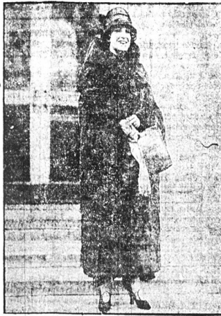
Gifford Pinchot, ów gubernatora stanu Pennsylvania wraca z audjencji a prez. Hardinga, któremu przedłożył plan działala. ności organizacji kobiecych