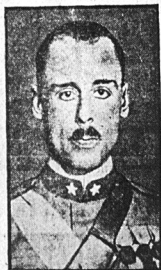
Książę Carlo di Bergola