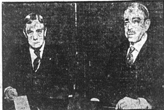
Hubert Work (z prawej) generały pocztmistrz mianowany został sekretarzem w departamencie dla spraw wewnętrznych, a senator New (z lewej) obejmuje posadę generalnego pocztmistrza w kraju.