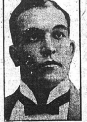
Jim Jeffries, który posiadał 14 milionów dolarów obankrutował i został bez centa.

Francja protestuje przeciw wyjazdowi angielskich okrętów ze Smyrny LONDYN, 2 marca. — Ambasador francuski przedłożył dzisiaj w angielskim ministerium spraw zagranicznych protest rządu francuskiego przeciw wyjazdowi angielskich okrętów wojennych z portu Smyrny. Ambasador francuski przedstawił także notę premiera Poincarégo domagającą się stanowczego wyjaśnienia, jakie stanowisko zajmie Anglia, w razie gdy Turcja nie zatwierdzi traktatu pokoju przedłożonego jej przez aliantów na konferencji w Lozanie.