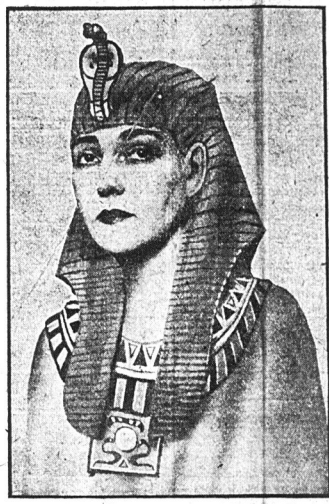
Z nadchodzącą wiosną modą będzie — egipska, z okrzyki wywołania zwłok faraona. Żywe i — kostowne mummie przypominają kulturę egipską. Na szczególną łaskę kobiety będą egipsko-modne.