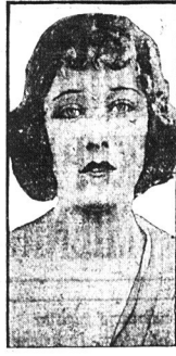
Gloria Swanson, piękna aktorka filmowa, raz drugi występuje w procesie rozwodowym, oskarżona przez męża za to, że od niego uciekła