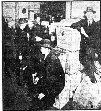
Świecie wydrutowane, ostatecznie wykonane marki niemieckie. Sprzedawane są po 20/27 za dolara. Do nabycia w większych ilościach w Now Yorku. Dostawa do domu w workach lub koszach