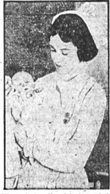
W szpitalu dla dzieci urodziło się dziecko nr. 75000, które z przyczynami narodowymi nie miało udziału w stułetniej rocznicy szpitala