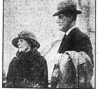
Były senator Poindexter mianowany został posłem Stanów Zjednoczonych do Peru i wyjechał wczoraj z Nowego Yorku