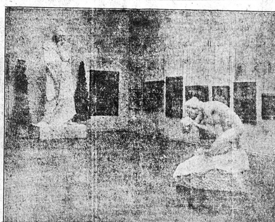
Rzeźby Wacława Szymanowskiego. (MATKA — MYŚLICIEL)