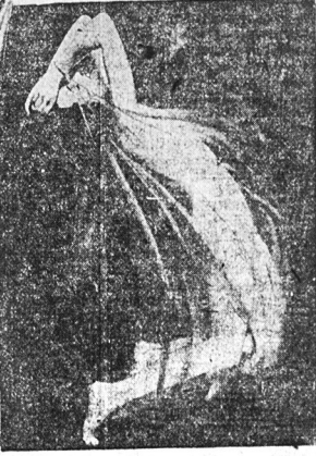
Rycina przedstawia „klasyczną” tancerkę we Wiedniu. Kostjum z gaz jest mocno perfumowany, wobec czego nie tylko uszy i oczy, lecz także i nosy bieżą udział w „wzrocie duchowym”.

Muzyki kompozycje, specjalne utwory, dal nowe matczeni.