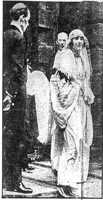
Syn angielskiego króla książkę Yorku posłubił Elizabeth Bowes-Lyon, która z tej okazji mianowana została księżną w Anglii.