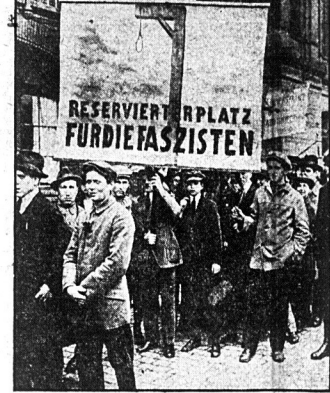
W Berlinie, podczas obchodu majowego obnoszono tablicę z sżubienią z podpisem: „Miejsce rezerwowane dla faszystów”