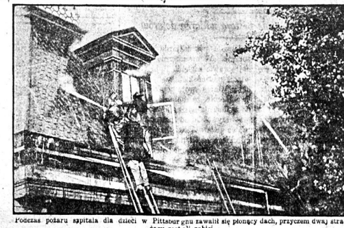
Podczas pożaru szpitala dla dzieci w Pittsburgu zawalił się płonący dach, przyczem dwa strażacy zostali avari

Dzyszyrujący na Broadway i 53 ulicy policjant aresztował 3-ech podejrzanych wyglądających mędrdzu, trzymając w ręce walizki. Aresztowani przyznali się, że znajdują w walizkach materiały pochodzący z kradzieży, ale miejscu nie wymienili.