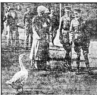
Gdy królowa angielska w towarzystwie króla zwiadała koszykarzy kawalerii w Aldershot-angielki odwołanie przyniła parę śledczą

Koszykarze Porządek mityngów sztapowych następujący: CZWARTEK, 7 czerwca, godz. 5:30 — Minnet, 123 Hudson ul. Hoboken, N. J. PIĄTEK, 8 czerwca, godz. 5:30 — 123 Hudson ul. Hoboken, N. J. PIĄTEK, 8 czerwca, godz. 5:30 — Bielecki, Woodside, L. I.