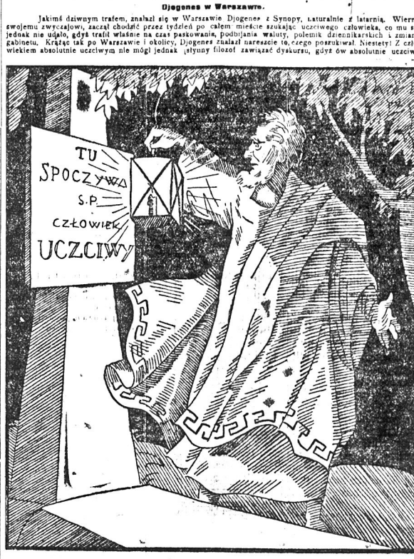
człowiek zmarł przed 30 laty i Diogenes znalazł go pod grobowcem na Powązkach.

się lekliwie do stóp pierwszego lepszego przechodnia. Na kilka dni przed pierwszym zwierzęta jakby w półśnie, osowiały, osupiały. Od czasu do czasu zrywały się i gnały, jakby szukając rozpaczliwie dla siebie bezpiecznej kryjówki. Ptaki umilkły zupełnie, jakby tknięte paralizem. Najduższe wytrwały na posterunku żalajce. Motylów dlatego, że nikt nie trudił się, by je właśnie w tym czasie szczególnie oglądać i wiać za nimi do kapusty. Dość, że siedziały do ostatniej chwili na opuszczonych miedzach i grzędach, zmykając co sił starczy dopiero pod naporem strumieni lawy. Poprostu mogły śmiało ufać nogom swoim, wobec czego nie uznają zagłuszone uległe przeczuciu. W Brońnie zalegano perię olbrzymiej wielkości, która przedstawiała wartość 60.000 dolarów. Perię wysłano do Londynu.