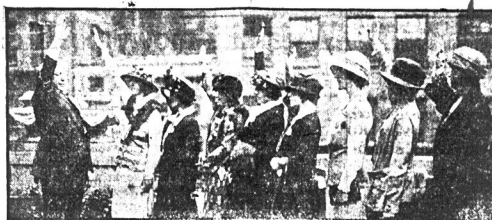
Urzędniczki przydzielone do pomocy prezydentowi Coolidge'owi składają przysięgę na „wiernej służbie”.