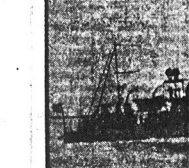
Krażownik amerykański „Woodbury” wpadł na rafy w pobliżu Kalifornii. Z obsługi zginęło 25 osób

MOSKWA. 14 września. — Sena tor R. La Follette i Wisconsin wyje chadźc do Warszawy w celu pro wadzenia do St. Zje. — „Dzienniki narodowy amerykański prawi do Rosji i ta prawda będzie się bardzo różnić od tego co dotychczas sęga dano o Rosji”. — powiedział sam senator La Follette przed opuszczeniem Moskwy.