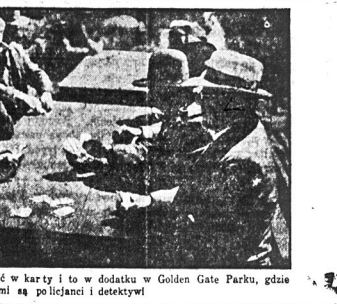
W San Francisco wolno dziś każdemu grać w karty i to w dodatku w Golden Gate Parku, gdzie spektatorami są policjanci i detektywi

Baczność Szanowna Polonia w Mas peth i Okolicy! Gmina Polska, Inc. ze współduch nym wszystkich towarzystw w Mas peth, L. L. urządzi WIELKI PIKNIK w własnym Domu Narodowym, wóg Clinton i Willow Ave., Maspeh, L. L. w niedziele, dnia 16-go września 1923. Początek o godzinie 12-go po południu. Muzyka dobrorowa polska. Wstęp 35c od osoby. Szan. Rodacy i Akcjonariusze Do mu Narodowego w Maspeh! Urzą dzając powyższy piknik, mamy nadzie ję, iż Szanowna Polonia w Maspeh i Okolicy poprze naszą zamyśl, przez jak najliczniejsze przybiecie, gdyż ob chód z tego pikniku przeznaczony na powiększenie Domu Narodowego w Maspeh. W nadziei, iż przybędziecie wspany na piknik, aby w własnym domu wspólnie się ubawić. KOMITEK.