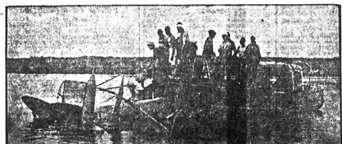
Gdy hydroplan wpadł do rzeki Potomac z wycieczki 2,200 osób, usiłował pilot i obserwator