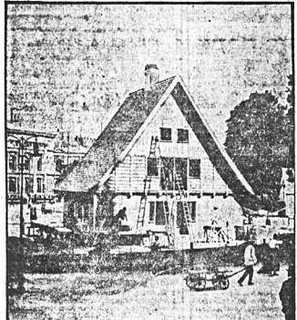
Dom powyższy wraz z łąką kosztuje tylko $500. Tanie — nieprawda! Jeżeli chcecie kupić podobny udajcie się do Austrii, gdzie pewna kompanja ofiarowuje swe usługi za cenę $500