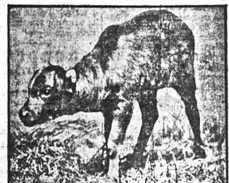
Ciekawa odmiana bawołu, znajdującego się obecnie w ogrodzie zoologicznym w Bronx, N. Y.