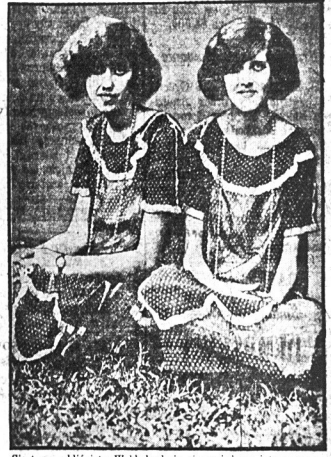
Siostry — bliźnięta Webb kochają się w jednym i tym samym calowisku i twierdzą, że mogłyby z nim żyć w zgodzie nawet bez ślubu