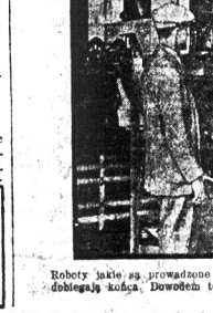
Roboty jakie są prowadzone przy budowie aeroplau. Jak i ma odbyć podróż naokoło kuli ziemskiej, dobiegną kolca. Dowodem tego może byćż stała rytna, która została zdjęta w warunkach Douglas w Santa Monica, Cal.