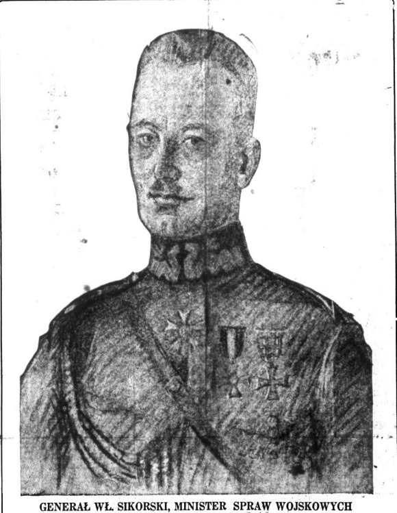
GENERAL WŁ. SIKORSKI, MINISTER SPRAW WOJSKOWYCH

BUDAPEST, 18 lutego. — Spadek wartości korony węgierskiej poniżej korony austriackiej, do 90 tysięcy za dolara, wywołał popoch w społeczeństwie węgierskim, które straciło nadzieję w możliwości uzyskania międzynarodowej pożyczki, mimo zapewnienia premiera Belleny, że ma nadzieję na uzyskanie pożyczki zagranicznej. Rząd premiera Belleny zwrócił się do wielkich banków z żądaniem udzielenia rządowi miliona dolarów pożyczki na pokrycie niedostatek budżetowy. Dyrektor anglo-austriackiego banku, S. Mon. Krausz, który dopuszczono