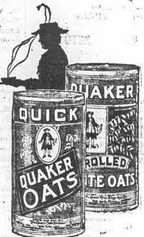
2 gatunki QUAKER OATS OBECNIE W GROSZNIACH — gatunek, któryście zawsze znali i nowy QUICK QUAKER