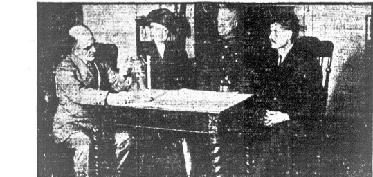
Gen. Lenn, od którego ginęły w czasie wojny całe polski wojska, został przeobrażony przez Col. Gilchrist na środek zwalczający zarazki influenzy

od sta roczne będzie wypisywana na konto depozytariuszy za trzy miesiące, kończące się 31-go marca, 1924, od wszystkich sum, uprzednio- wozłożonych na obowiązkowe depozyty, według raty CZTERY PROCENT OD STA RÓCZ- nie, płatna 15-go kwietnia i później. Sumy złożone 31 kwietnia lub przedtem będą procentowały od 1-go kwietnia 1924.