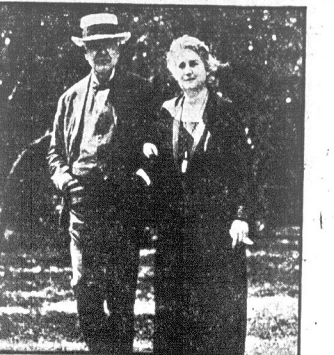
Thomas Edison i jego żona spędzają dzień na przechadzkach po wspaniałym, ogrodzie wili w Fort Meyers