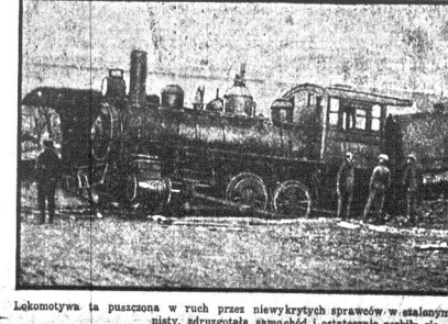
Lokomotywa ta puszczona w ruch przez niewykrytych sprawców w stalowym pędzie, bez maski, strągnęła samochód i ostatecznie rozbija się