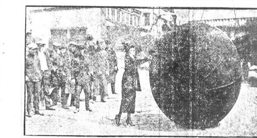
Powyżej przedstawiona piłka toczona była z Chicago do New Yorku przyczem zbirano pieniądze na letnisko dla weteranów