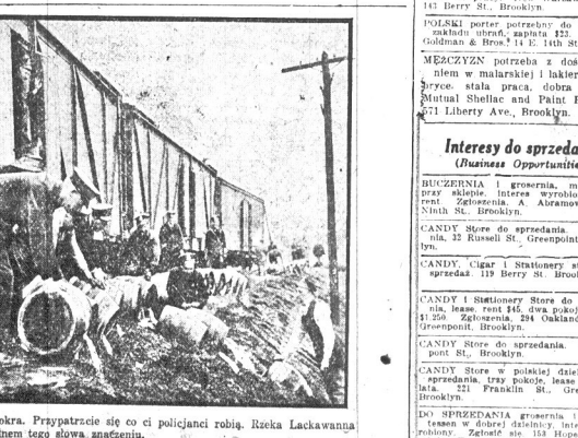
Nie dziwne, że wioma taka mokra. Przypatrzyć się co i policjanci robią. Rzeka Luchawanna będzie oddat „mokry” w pełnem tego słowa znaczeniu.