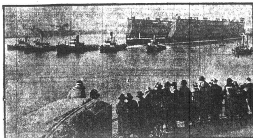
Nowy pływający dok obecnie urządzony został w porcie Southampton. Dok ten może przetrzymać i miesiąc ciężar wagi 60,000 ton.