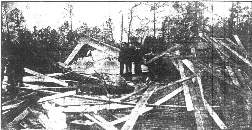
Krywa przedstawia obryzkie spustoszenie wyrządzone przez bryzo, która strąciła kawałek drzewa szalwca nad brzoziem, który w chwili katastrofy był w porcie.