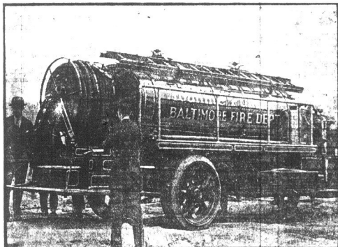
Straz pożarna w Baltimore może poszczycić się posiadaniem najnowszej, automatycznej, sikawki.