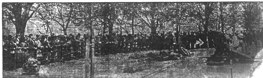
Policja nowojorska musiała ogrodzić miejsce na Riverside Drive, gdzie zdarzył się wypadek samochodu.