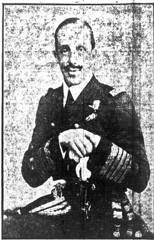
Tak wygląda wesoly, lekkochylszy król hiszpański Alfonso, jeden z nielicznych pomazanów bożych w Europie

MEXIKO CYT, 10 maja. — Prezydent Obregon ogłosił dekret upoważniający ministra finansów do wyprzedania wszystkich majątków rządowych niepotrzebnych dla użytku publicznego, a dochód ze sprzedanych majątków użyć na wypłatę zalegających pensji w sumie 20,000,000