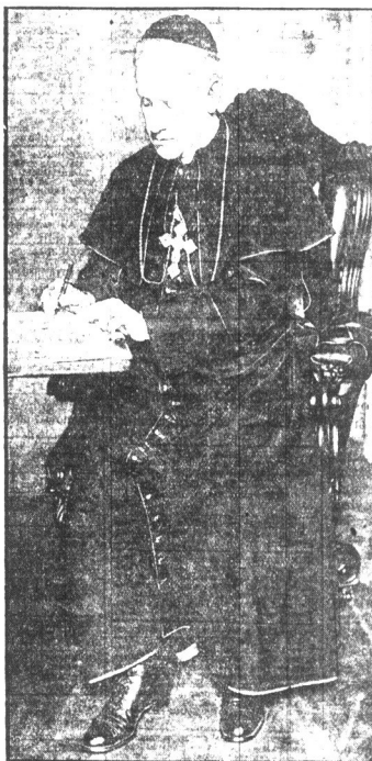
Kardynał Hayes rozpoznał swoją katedrę jako kardynał osiemnaście lat do zboru parafialnego na ten dzień.