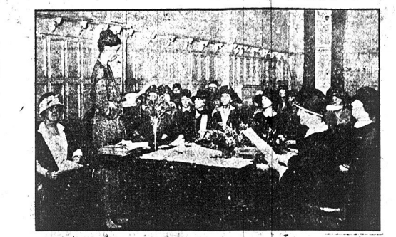
Pani Franklin Roosevelt przewodnicząca Izbie demokratów w Nowym Jorku na którym domagano się „suchego” programu partji