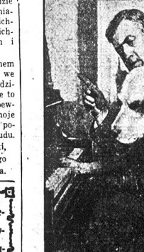
Pies novelty Rex Beach grał na fortepianie...