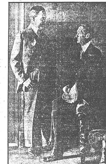
Ważna chwila w Madison Square Garden. William Jennings Bryan błaga konwencję, aby wybrała McAdoo