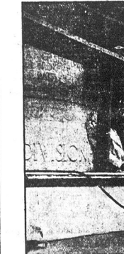
Sekretarz wojny Weeks oddania w Washingtonie tablicy pamiątkowej ku uczczeniu pamięci poległych żołnierzy

Śmierć prawdopodobnie nastąpiła skutkiem udaru serca.