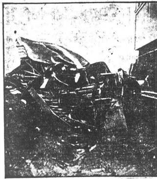
Wskok zderzenia w Willow Grove Parku cztery osoby straciły życie. Jedna chwila nieostrożności zmniejszyła życie czterech osób

powstała z zaburzeń żołądkowych. Czy zastanawiacie się kiedy, czy Wasza choroba nie była lub jest początkiem niedomagania żołądkowego? O ile tak to spróbujcie używać nowego wynalazku niemieckiego lekarstwa KATRO-LEK, które tysiącnie wyleczyło i tym uratowało życie. W razie gdyby Wasz aptekarz lub agent nie miał KATRO-LEK, to piszcie zaraz po takowy do wyznaczonego przez nas biura, adresując do W. WOTJASINSKI DRUG CO., 114 Brighton St., Boston.