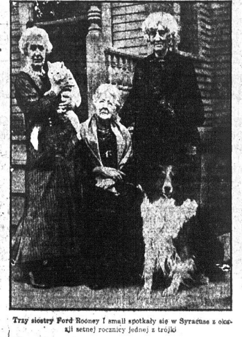
Tyż słoty Ford Rooney i smali spotkaly się w Syracuse s okon. Jak sjetnej rozczytanej jednej z trojki

Czytając Nowy Świat, a m m zamieszcezone Państwo skłice o różnych biedach, ośmielał się postać dołera. Jak się dorobio, to dam wzięcia. Jestem niedawno z Polski, zadłużony jeszcze. Szczęry N. Z. Dolar Twój, który otrzymałem dzisiaj w liście odholowy i wręczę go osobie tam, gdzie potrzebna będzie najskuteczniejsza. Włoczęga.