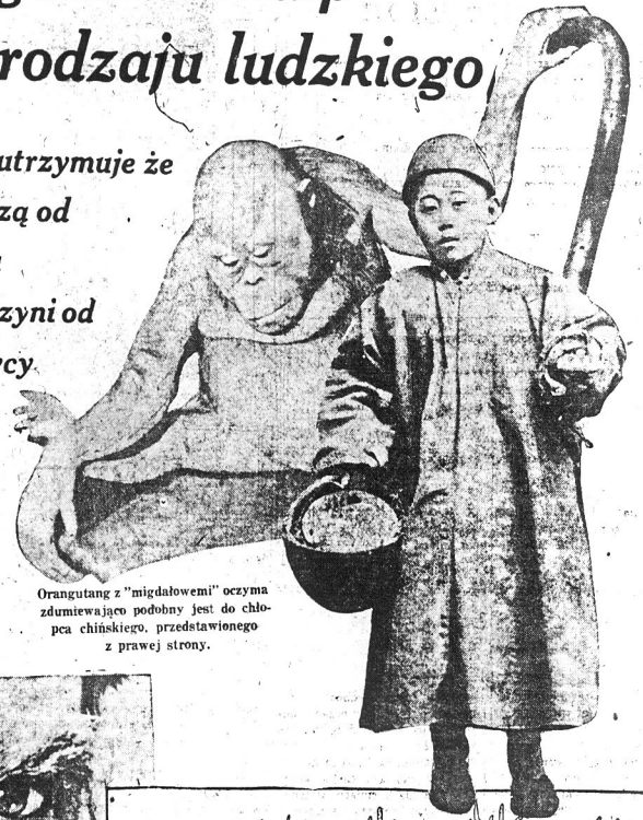
Orangutang z "migdałowem" oczyma zdumiewająco podobny jest do chłopca chińskiego, przedstawionego z prawej strony.