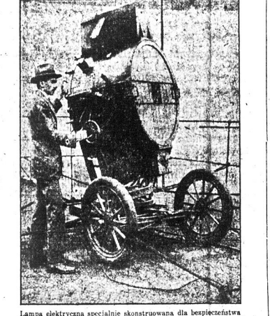
Lampa elektryczna specjalnie skonstruowana dla bezpieczeństwa lotników, którzy w nocy przewożą pocztę.