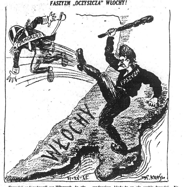
Faszyści zdecydowali we Włoszech, że głosowanie zabiera ludność czasu i niepotrzebnie ich odciąga od pracy. Poco ma ludność zajmować się rządzeniem, kiedy to za nią zrobią faszyści. Na początek idzie pod but barbarzyńcy samorząd miejski. A dalej, zobaczymy...

Wynikalyo przytę, że załedwie połowa przyszłych dzieci inteligentnych będzie już w łonie matki systematycznie podwezana na progę życia. Summa summarum ten bunt gotawosów piłżięk przeciw „bezdmymy” większą szkodę przyniesie pokoleniu przyniesie niż wstrędo do bezdmymego prochu, okazywany przed młodzieżą męską w College of the City of New York. Zresztą ten ostatni bunt wogóle nie nalezy do nie-