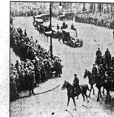
Thuny witaly przyjeżdżającego Colledge'a, który przybył ostatnio do New Yorku wraz z małżonką. W motowóz, która miała miejsce w jebie handlowej, prezydent Coolidge wypowiedział się za uczestnictwem Stanów Zjednoczonych w Trybunale Haskim