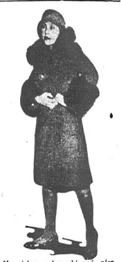
Na piękne pociągarki pal, mieszczące przez ulicę błoto znalazła się ochrona. Na pociągarki jedwabne pięknie panie będą naciągac pokrowce Revalotale

Temczasem w klubie zaangażowana nowa tancerka i zapominano zupełnie o młodej siostrzyczce Vivian, która siedziała w zimnej i ponurej celi, czekając na wymiar sprawiedliwości za winy popelnione przez młodzieńca, którego kochała i jakiego bezgranicznie ufała.