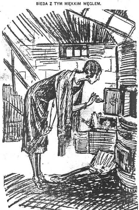
Jedna z wielu gorących przeciwników przedłużania się strajku w zagłębiu antracytowym. Zimno się robi tej gorącej przeciwnice marnogła we własnym mieszkaniu, gdy pomyśli, że jeszcze będzie miała ze dwa miesiące tej mordgi z piecem, zaczynającym stygnąć, nim się na dobre rozpała. „Och!”, „ach!” wzdychają „jednofamilijne” basemnty wołające o twarde węgiel.