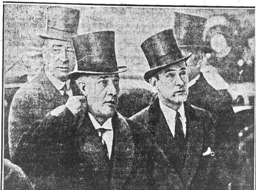
W pogrzebie zmarłego wydawcy i dziennikarza Franka Munsey'a wzięły udział wybitne osobistości ze świata finansowego, politycznego i naukowego. Na powyższej rycinie widzimy gubernatora Smith'a, który był serdecznym przyjacielem zmarłego, oraz majora Walker'a.