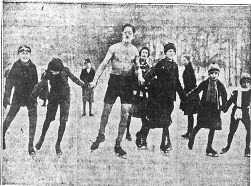
Kto powiada, że zimno? Zwolnienicy życia natury w Niemczech mimo śnieżnego mrozu, ślizgają się w Berlinie ubrani tylko w trykoty, jak na powyższej rycinie widzimy.