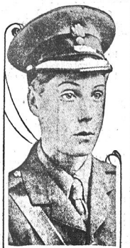
Księżę Walji, następcę angielskiego tronu, podobno miał się zakochać w 20-letniej kuzynce króla szwedzkiego.