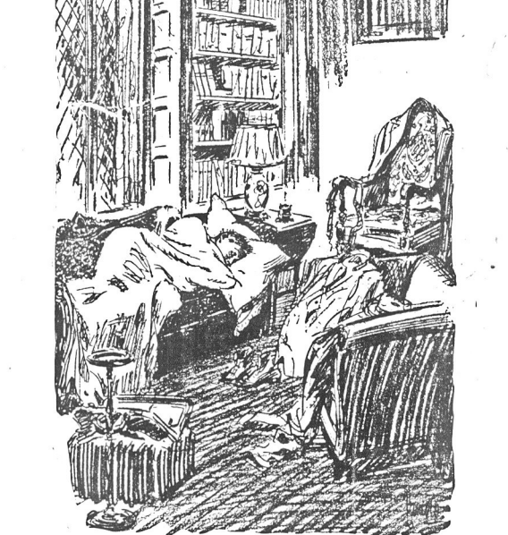
Trudno dojść, co to się w domu tym stało. Jakie okoliczności poprzedziły ten nocleg pana domu w zbytkownie urządzonym salonie, który każde się domyślał istnienia wygodniejszej sypialni za ścianą. Wrodzona przenikliwość i miłe wspomnienia z nocy sylwestrowej ułatwia czytelnikowi rozwiązanie tej zagadki.