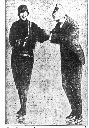
Henry Ford mimo swego podeszłego wieku jest zwolennikiem sportów zimowych, którym się oddaje z zapalem w swej zimowej rezydencji w Sudbury, Mass.