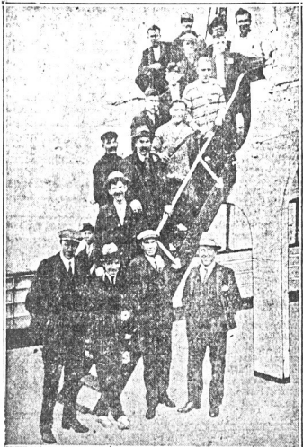
Jeżeli to fotografia załogi tragicznie zatopionego statku angielskiego „Antinom”. Fotografja zdjeta na pokładzie okrętu „President Roosevelt” w chwili postoju w porcie Plymouth.

Wielki wybór skrypcze pierwszorządnych po naj-niższej cenie. Najlepszego gatunku gramofony po przystępnych cenach. Pianole, Fortepiany, Harmonie i wszelkie inne instrumenty muzycz-nej na łatwe spłaty. — Najnowsze rekordi i rolki muzyczne.